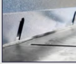
Döküm Taşlanmış Tabla Cast Iron Ground Table

ANGRAJLI GİYOTİN MAKAS MOTORIZED GUILLOTINE SHEAR