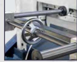
Arka Dayama 600 mm Back Gauge 600 mm