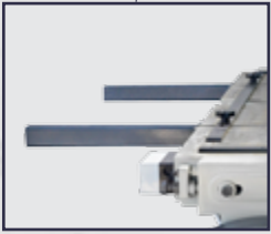
Tabaka Saclar İçin Ön Destek Kolları Front Support Arms