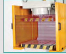
İşık Perdesi Light Curtain