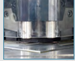
Sabit 90° Açılı Bıçaklar Fixed 90° Blades