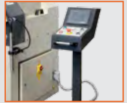
NC Kumanda Paneli NC Control Unit