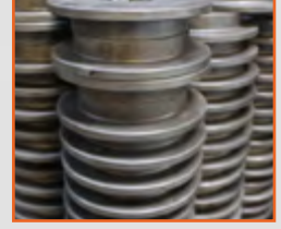
Özel profil bükme valsleri Profile bending rolls