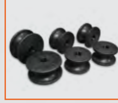
Boru Bükme Vals Topları Pipe / Tube Bending Rolls