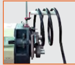
Spiral bükme vinci Spiral bending crane